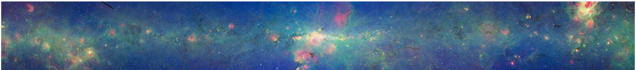
Mosaico della Via Lattea ottenuto nell'infrarosso dal telescopio spaziale Spitzer